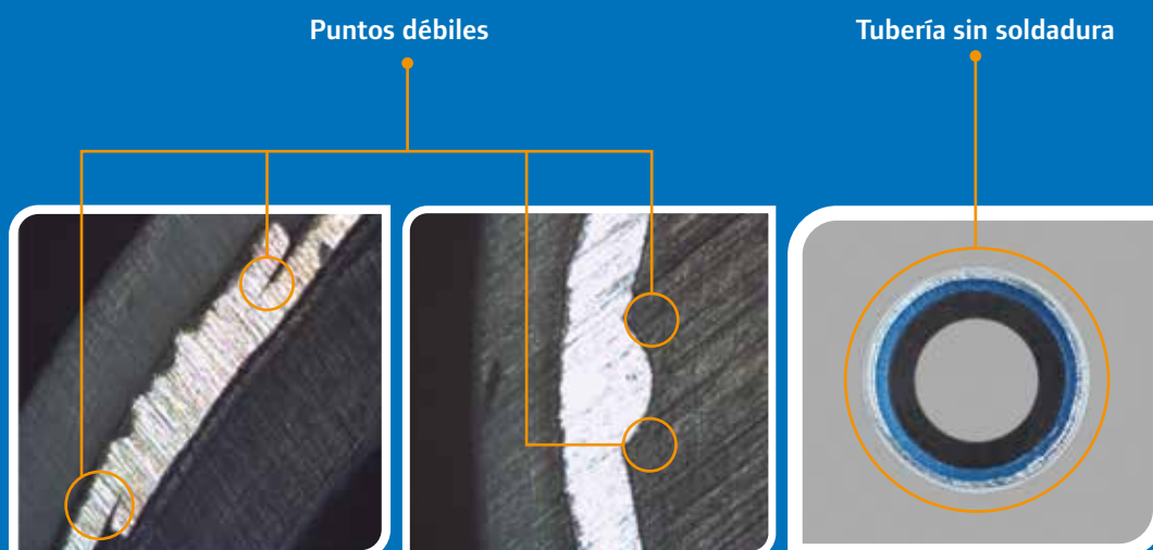
Tuberías soldadas a solape

Mayor potencial de pinzamiento de la tubería y mayor rigidez de los rollos debido al doble grosor del aluminio en la zona de soldadura.